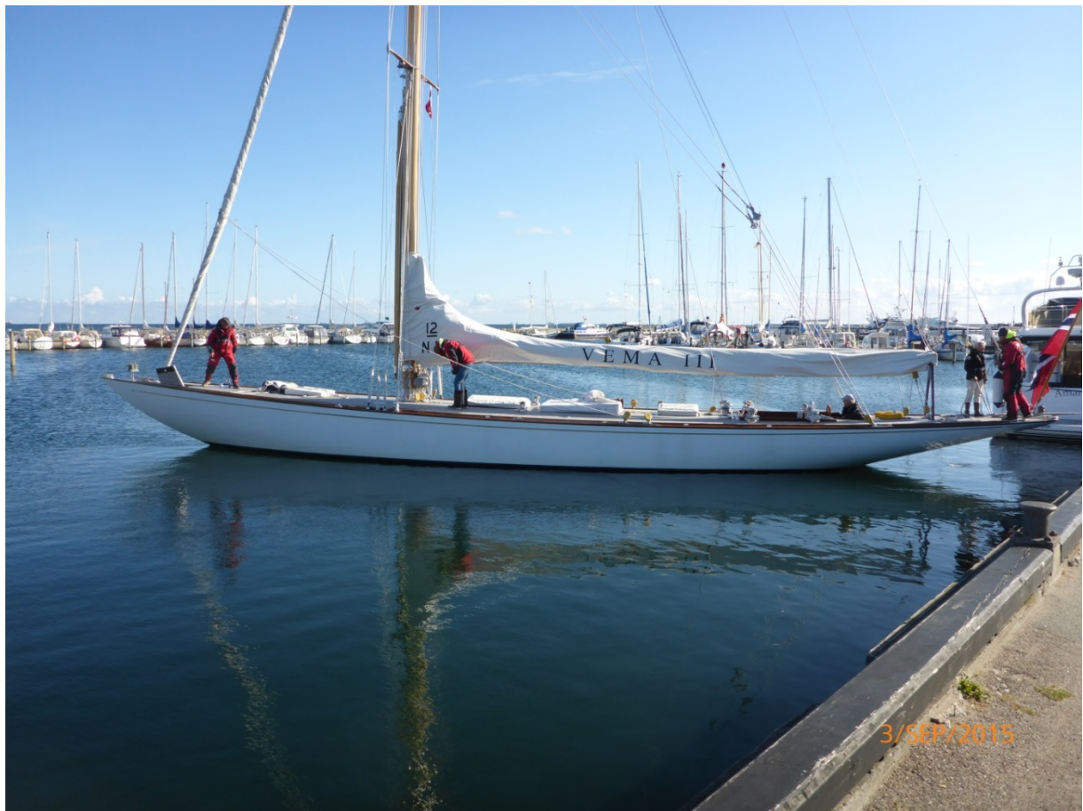
En ægte 12 meter afgår Dragør havn