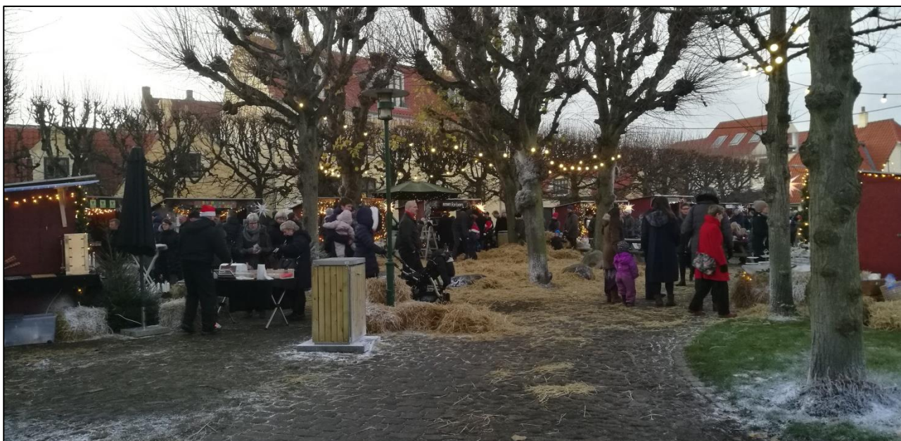
Julemarked i Dragør – så bli'r det da ikke hyggeligere...